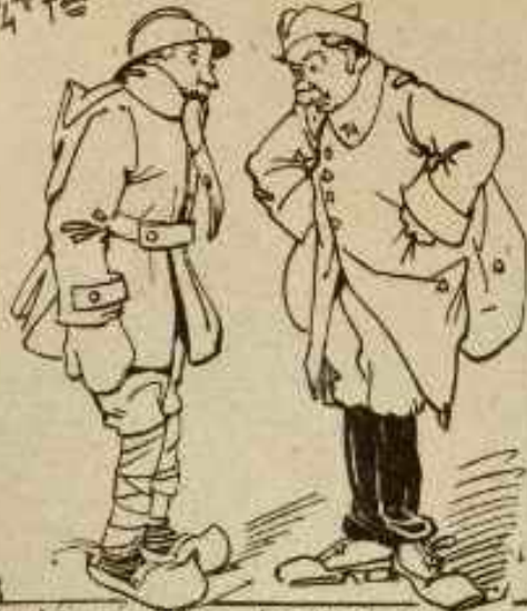
Fig. j'en ai vu d'autres. demandez aux maîtres fermiers. j'consulte mes thèses de carte.