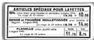
Tampon texte couture