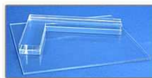
Positionneur pour tampons