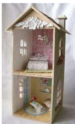
Une création de Beatriz Jennings

Commençons par faire un peu d'histoire voulez-vous ? A l'origine étaient, en scrap tout du moins, la page, le papier, l'image, le livre, l'album..., enfin bref, des trucs plus ou moins plats et en 2 dimensions seulement (longueur & largeur) Très vite cependant, le besoin et aussi l'envie d'agrémenter/décorer la chose scappée ont conduit à l'ajout d'éléments qui eux n'étaient plus forcément limités en épaisseur, surtout à partir du moment où nos pages ont commencé à sortir de nos albums pour être exposées. Ensuite, la mode des mini-albums a largement contribué à populariser l'utilisation de la 3D, tout comme celle très actuelle du scrap sur support, ce qu'on nomme volontiers aujourd'hui le "home déco" ; qu'il s'agisse d'un canvas, d'une ardoise, d'un cadre, d'un cube, d'une bougie..., ou de tout autre élément en volume, dans lequel d'ailleurs la photo n'est plus forcément obligatoire, et qui est souvent destiné à être exposé dans nos intérieurs.