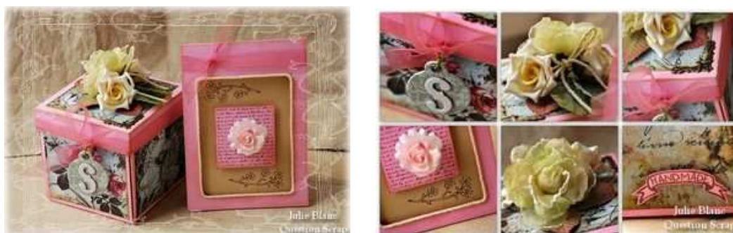
Une réalisation de Julie

Commençons par faire un peu d'histoire voulez-vous ? A l'origine étaient, en scrap tout du moins, la page, le papier, l'image, le livre, l'album..., enfin bref, des trucs plus ou moins plats et en 2 dimensions seulement (longueur & largeur) Très vite cependant, le besoin et aussi l'envie d'agrémenter/décorer la chose scappée ont conduit à l'ajout d'éléments qui eux n'étaient plus forcément limités en épaisseur, surtout à partir du moment où nos pages ont commencé à sortir de nos albums pour être exposées. Ensuite, la mode des mini-albums a largement contribué à populariser l'utilisation de la 3D, tout comme celle très actuelle du scrap sur support, ce qu'on nomme volontiers aujourd'hui le "home déco" ; qu'il s'agisse d'un canvas, d'une ardoise, d'un cadre, d'un cube, d'une bougie..., ou de tout autre élément en volume, dans lequel d'ailleurs la photo n'est plus forcément obligatoire, et qui est souvent destiné à être exposé dans nos intérieurs.