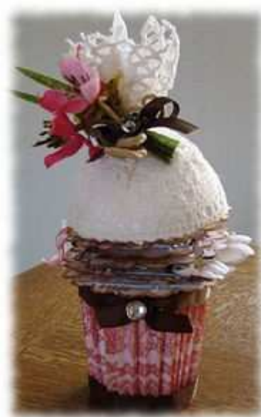
Une création de Chriscrap