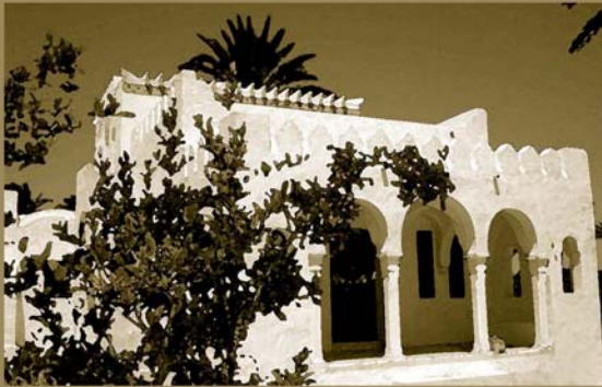
Member of theTingitingi Project