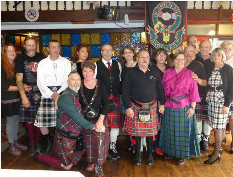
A.G des Amis en kilts à la Clé