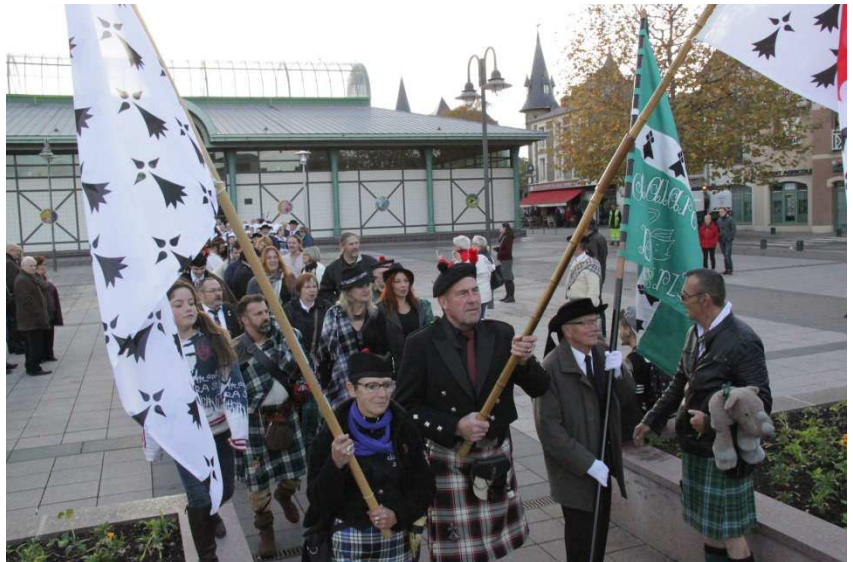
Saint Arthur à Dinard