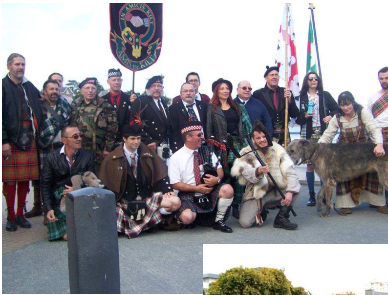
Saint Arthur à Dinard