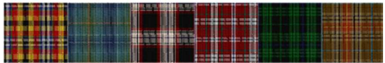
Eusa Glaz Bro Wened Bro Zol Menez Du Brittany Walking