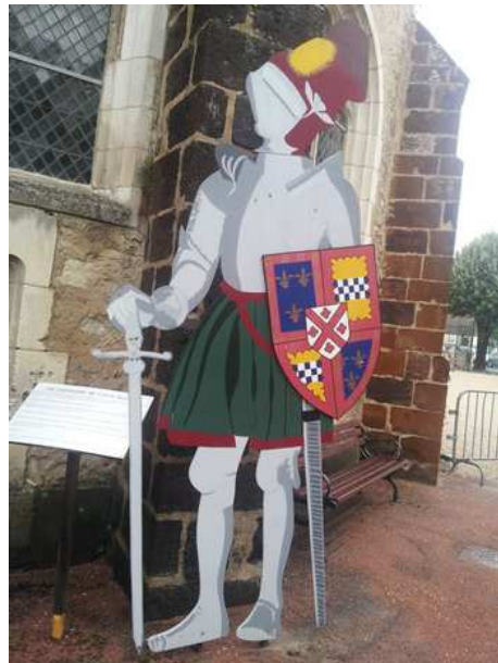
Valérie et les chevaliers de l'Auld Alliance