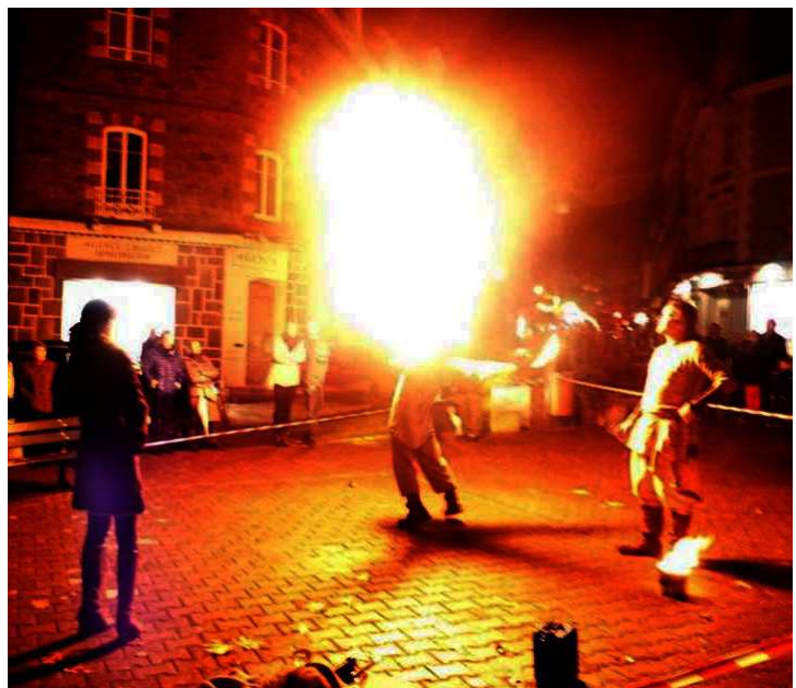
Lonos et Thorwulf enflamme la place