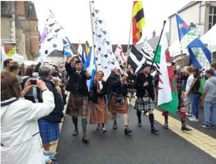
Les porteurs de drapeaux