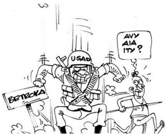
Newsmada - 12/03/16

La banalisation de la prostitution de mineures se confirme, en lien avec la démocratisation de l'accès à Internet et aux réseaux sociaux. Une proposition préoccupante de jeunes filles adopte des comportements qualifiés de « pré-prostitutionnels ». L'ONG Ecpat France Madagascar lance une grande campagne de sensibilisation auprès des jeunes, des parents et des autorités.