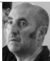
Inscriptions Didier SOULLARD