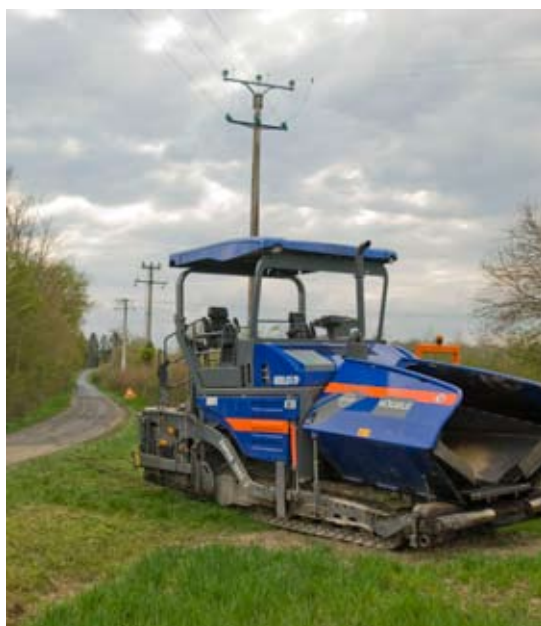
Réfection route du Carroux