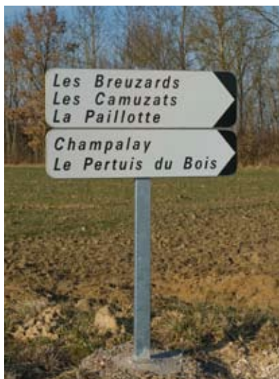
Signalisation des hameaux