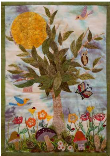
01 : J'ai rêvé d'un autre monde, ou la terre serait ronde... et la nature serait reine. Monique Huber