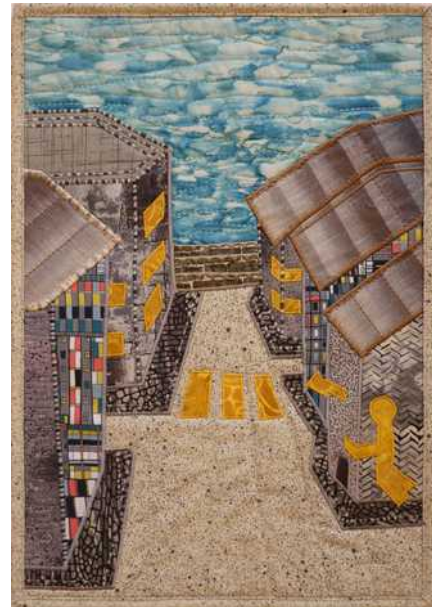
02 : Je me laisse guider et là...la flèche...le passage...