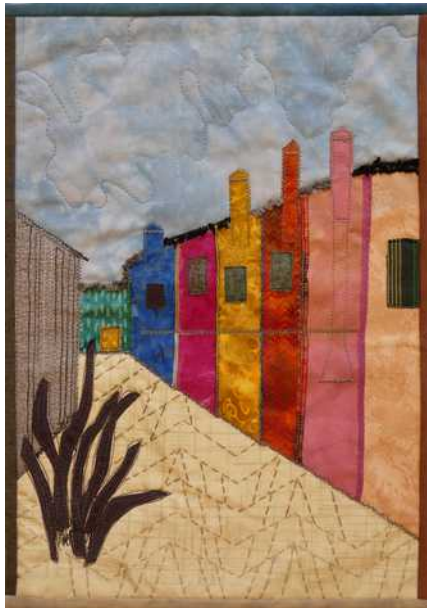
01 : Un arbre se meurt au pied des façades colorées.