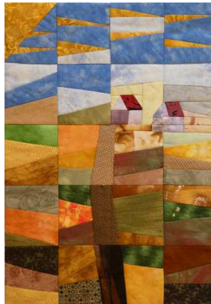
02 : Me baladant par monts et par vaux, j'aperçu au loin un village. Sylvia Grichting