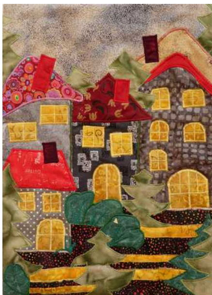
03 : Le village illuminé, se prépare pour la fête ! Marie-France Caillet-Bois