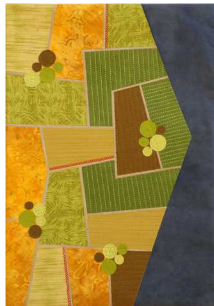
04 : Ma quête m'amène à emprunter la belle route côtière qui me permet de quitter le béton de la ville et de retrouver les doux coteaux aux couleurs estivales.