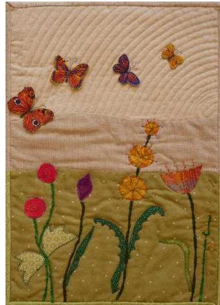
02 : De l'arbre, des papillons s'échappent hors de la ville.