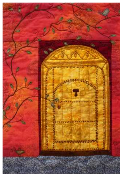
04 : Mais que se passe-t-il derrière cette porte ? Marie-Claude Mettraux