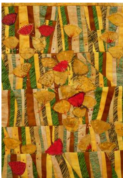
07 : La porte s'est fermée, l'oiseau s'est envolé, les blés sont fauchés, mais la vie reprendra Rachèle Aubord