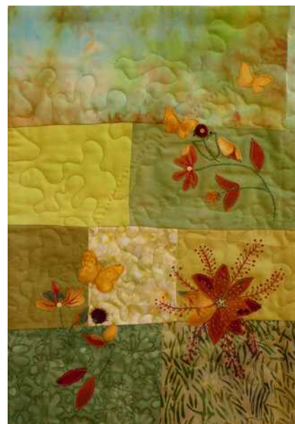
04 : Viens vite, c'est le printemps, viens avec moi voler de fleur en fleur.