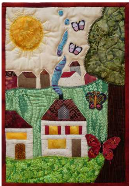
03 : Les papillons volent de maison en maison pour apporter la nouvelle.