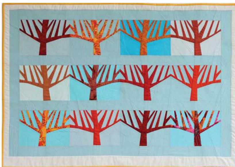
Carolyn Friedlander The Grove

Les 34 participantes ont été réparties en 5 groupes. Chacune avait deux mois pour réaliser un quilt de 28x40 cm en format vertical en s'inspirant d'une photo de la création précédente, accompagnée d'une phrase sensée aider à faire le lien. Le nouveau quilt terminé est alors photocopié en format A3 et envoyé à la prochaine participante avec une nouvelle phrase et ainsi de suite. Le challenge s'est déroulé sur une période de 14 mois et n'a subi aucun retard significatif.