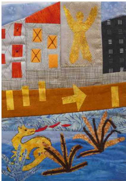
03 : Après avoir suivi la flèche, je les cherche, où sont-ils ?