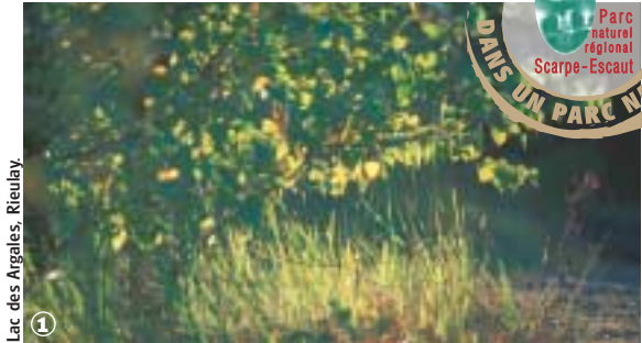
Lac des Argales, Rieulay.

Randonnée Pédestre Circuit du Marais des Onze Villes : 7 km