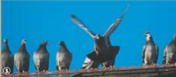
Pigeons en parade.

pays. Les mineurs construisaient dans leurs jardins des pigeonniers de fortune qui n'ont rien à voir avec les pigeonniers porches qui surplombent l'entrée des censes. A l'âge d'un an, le pigeon est prêt pour les concours. Auparavant il apprend à parcourir de courtes distances ; à retrouver sa maison et à faire confiance à son éleveur. La compagnie d'une femelle est