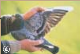
Coulonneux et pigeon.

d'un pigeonnet lors d'une vente aux enchères organisée une fois par an par les sociétés de colombophilie. Comme souvent dans le Nord, le colombophile tient sa passion de son père et grand-père eux-mêmes amateurs de pigeons. Le Nord, avec 30 000 licenciés et environ 900 associations, est la première région colombophile du