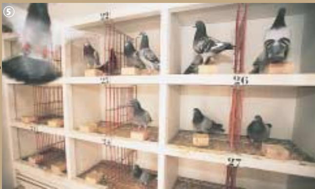
Pigeons en concours.

sa récompense pour cet apprentissage et ce n'est pas un hasard... Chaque concours récompense le pigeon capable de retrouver son colombier le plus rapidement possible, lâché d'un endroit précis. Les pigeons du Nord sont généralement lâchés dans la Somme, la région parisienne ; les plus forts du Limousin et les champions de Barcelone. Volant à une moyenne de 100 km/h, il faudra une journée à un pigeon pour parcourir cette distance, mais ne dit-on pas que l'amour donne des ailes... ! Pour les amateurs, découvrez la musée de la Colombophilie à Bouvignies (03.27.91.20.13).