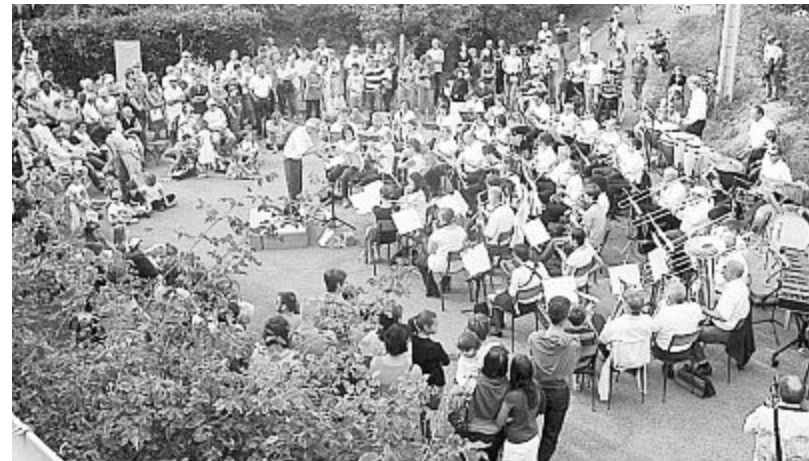
Chansons françaises, musique orchestrale avec 50 instrumentistes, conteurs... et pour les enfants l'automate, le jongleur de ballon, la fabrication de chapeaux en papier, toutes ces animations ont drainé une foule importante dimanche après-midi à l'Orguenais.