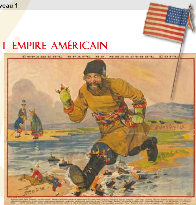
Reproduction d'un loubok, «L'ennemi est terrible, mais Dieu est miséricordieux», 1904.