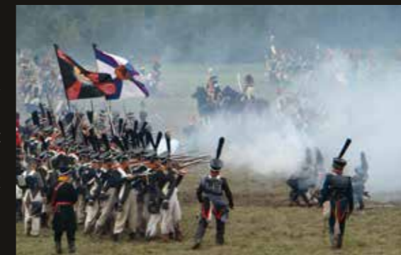
© Bertrand Normand - Les Films du Tamarin

PROJECTION Salle de conférences Hubert Curien