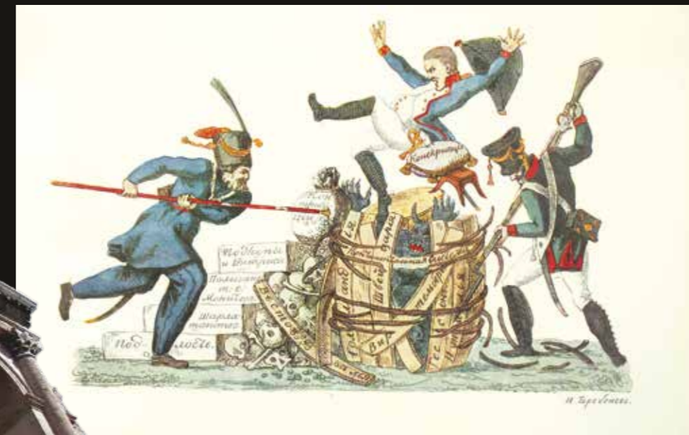
Reproduction d'un loubok, une image populaire, due à Ivan Terebenev dans la période 1812.