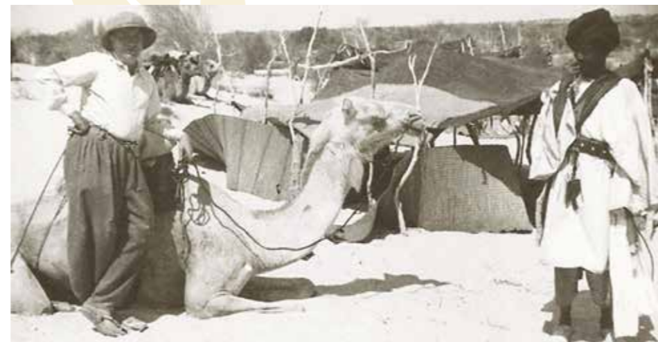
Campement targui, Mali 1933

CONFÉRENCE Salle de conférences Hubert Curien