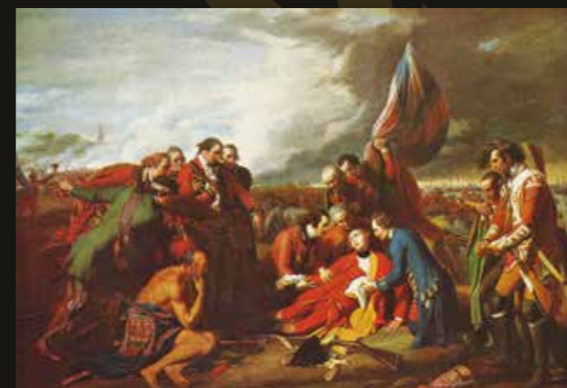
Les derniers instants du général britannique James Wolfe pendant la bataille de Québec (1759)

Benjamin West (1777) - collection Musée des beaux-arts du Canada, Ottawa