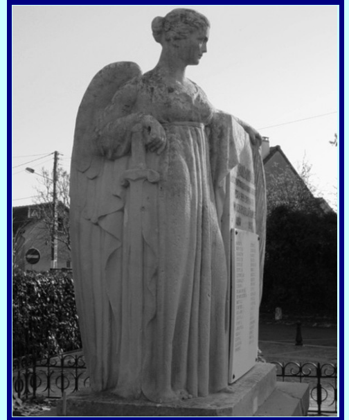
Le monument aux morts de Pontault-Combault, architecte: M. Delamarre

Au cours de la première guerre mondiale (1914 – 1918), 42 habitants de Pontault-Combault meurent sur les champs de bataille. En 1922, la municipalité décide d'ériger un monument en leur mémoire.