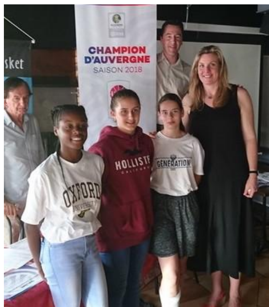
U13F1 de la CTC d'Isabelle, championnes d'Auvergne R1