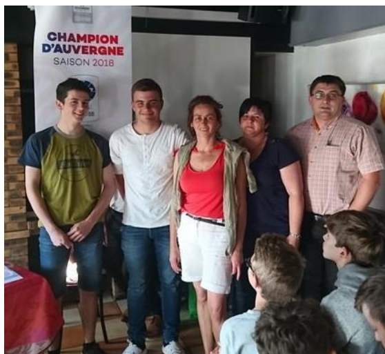
U17G2, champions d'Auvergne R2