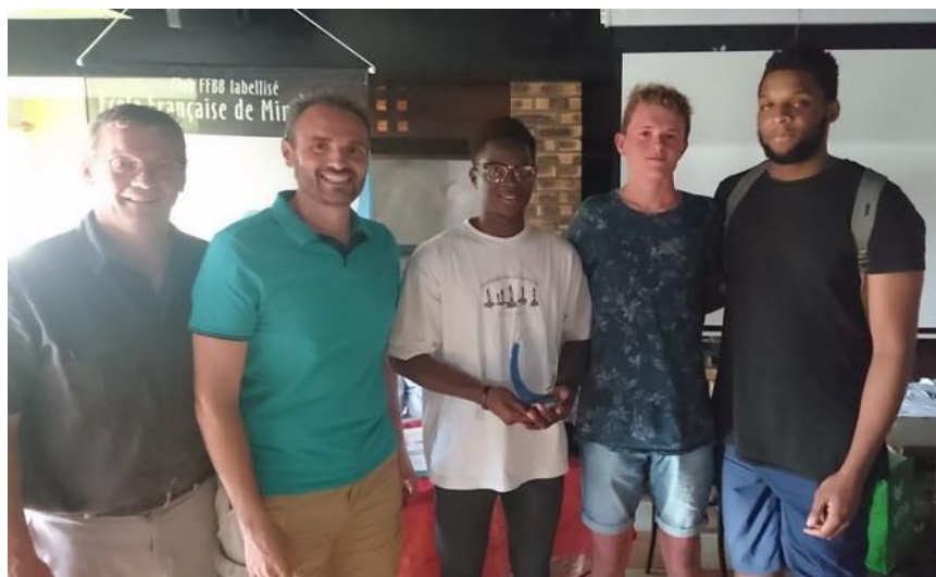
SG2, champions d'Allier