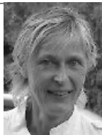
Inscriptions Christine GRZEGOREK