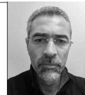
Matériel et inscriptions Michael THAUVIN