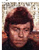
Luc Skywalker réalisé à partir d'images du film Star wars