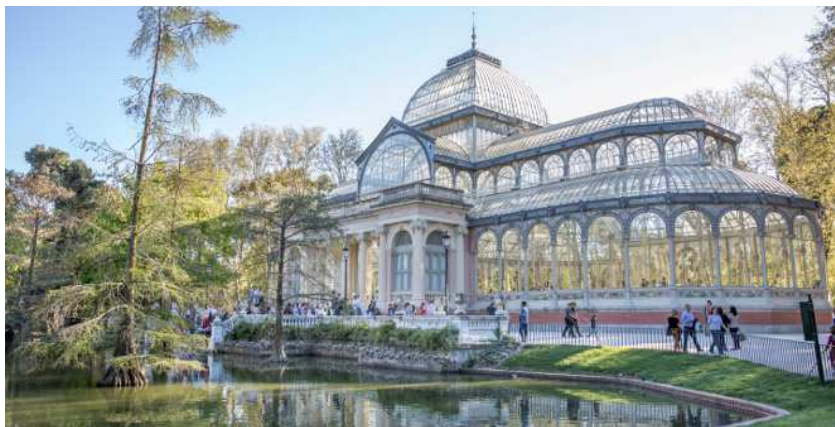
Palais de Cristal, Parque del Retiro

Ainsi, nous sommes allés au Parque Del Retiro, en interviewant quelques personnes dans le cadre de notre travail e-twinning sur le chemin. Dans le parc, nous avons fait un rallye de classe, en suivant notre livret de voyage. Nous avons donc vu des lieux importants du parc, tel que l'étang ou le palais de Cristal.