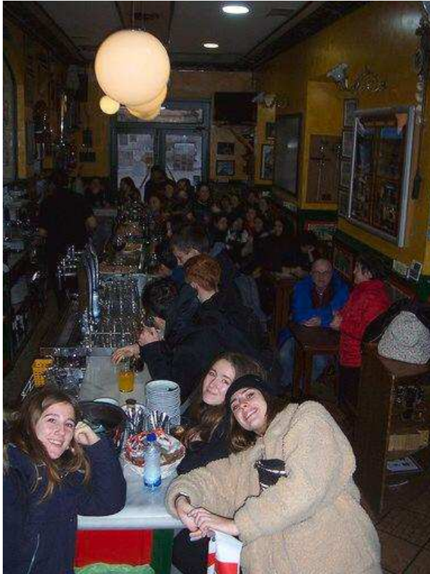
La classe de 1ES1 dans le bar à tapas