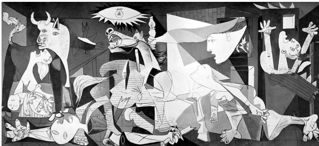
Pablo Picasso, Guernica (1937)

Plus tard dans la même journée, nous avons visité le musée Reina Sofia, dans lequel se trouve l'œuvre mythique de Picasso, Guernica. Cette œuvre a été peinte en 1937 suite aux bombardements de la ville basque de Guernica.