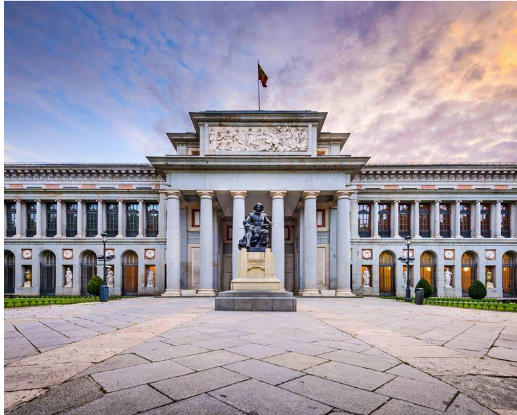
Musée du Prado, Madrid

Nous avons pu voir certaines grandes œuvres mondialement connues, de peintres tels qu'El Greco, Goya, Velázquez... La présence d'un guide a rendu les visites bien plus enrichissantes et interactives, chose qui a plus à la classe de 1ES1.