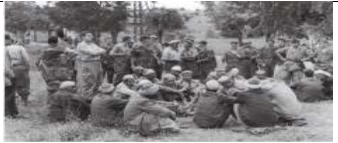
Arrestation d'Algériens après l'embuscade de Palestro, le 8 mai 1956, dans laquelle 17 soldats français ont été tués.