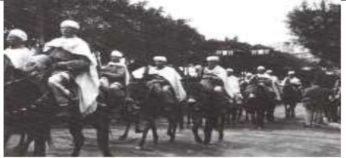
Document 2 : Une harka de harkis, musulmans constituant des unités militaires auxiliaires de l'armée française, défile à Bougie le 11 novembre 1956