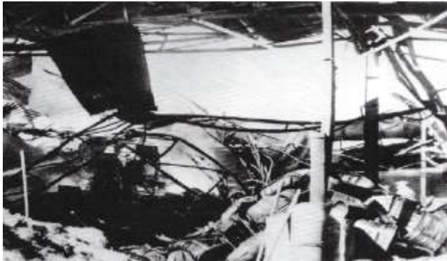
La coopérative d'agrumes de Boufarik (à 25 km au sud-ouest d'Alger) après l'attentat du 1 er novembre.

Document 2 : Communiqué du ministère de l'Intérieur, dirigé par F. Mitterrand, 1 er novembre 1954.