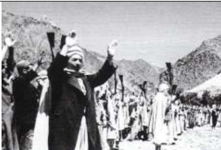
Le 8 mai 1945, après des heurts entre manifestants et la police, une véritable insurrection se répand dans les campagnes environnant Sétif et Guelma. Les violences et assassinats contre les civils français (86 morts) sont très brutalement réprimés par l'armée et des « milices civiles » et ont fait des milliers de victimes.