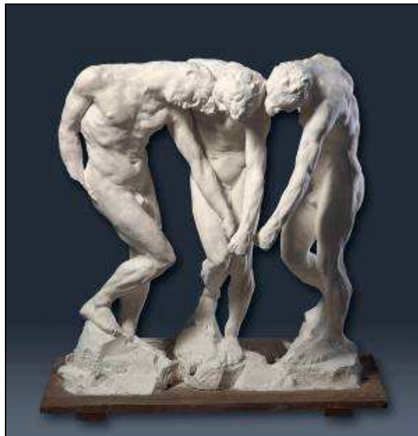
Les ombres 1886