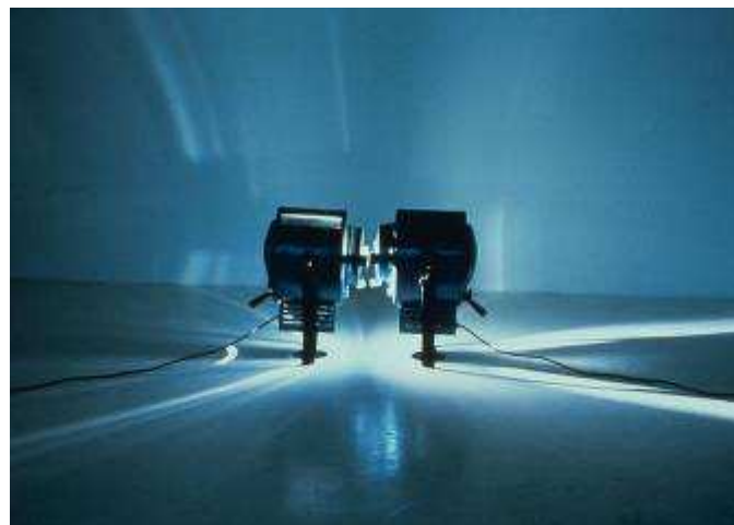
Ange LECCIA Le baiser 1985