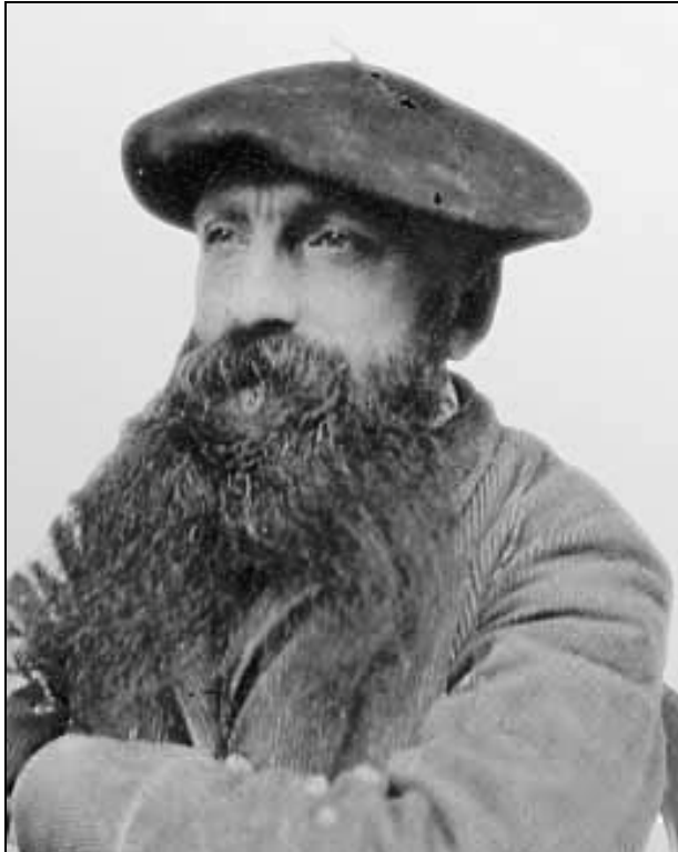
Auguste RODIN Photographie

Fortement influencé par la sculpture de Michel-Ange, il réalise sa première grande œuvre « L'Âge d'airain ». Sa statue donne une telle impression de vie, qu'on l'accuse d'avoir fait un moulage sur un modèle vivant.