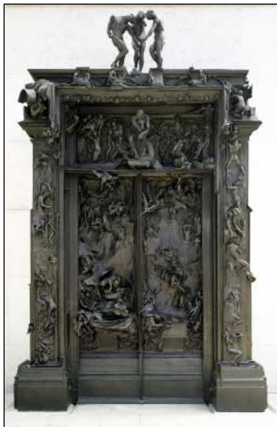
La Porte de l'enfer (bronze)