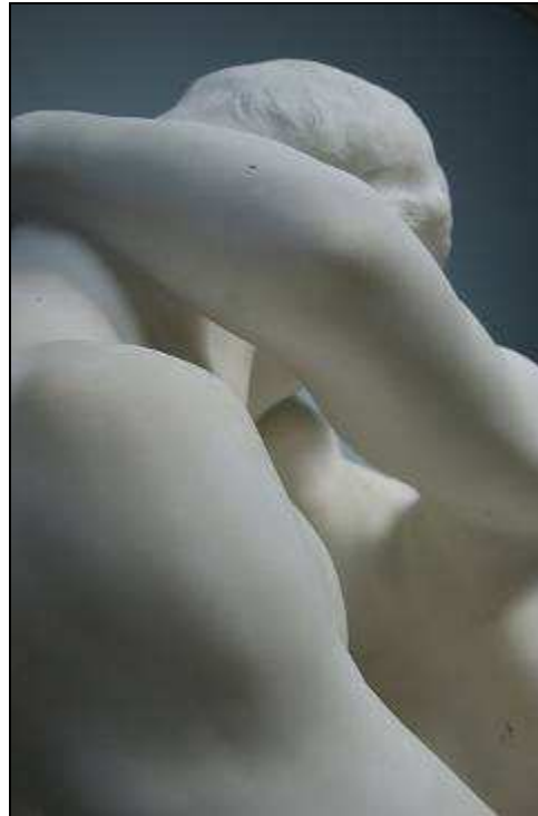
Auguste RODIN Le Baiser (détails) Plâtres et marbres