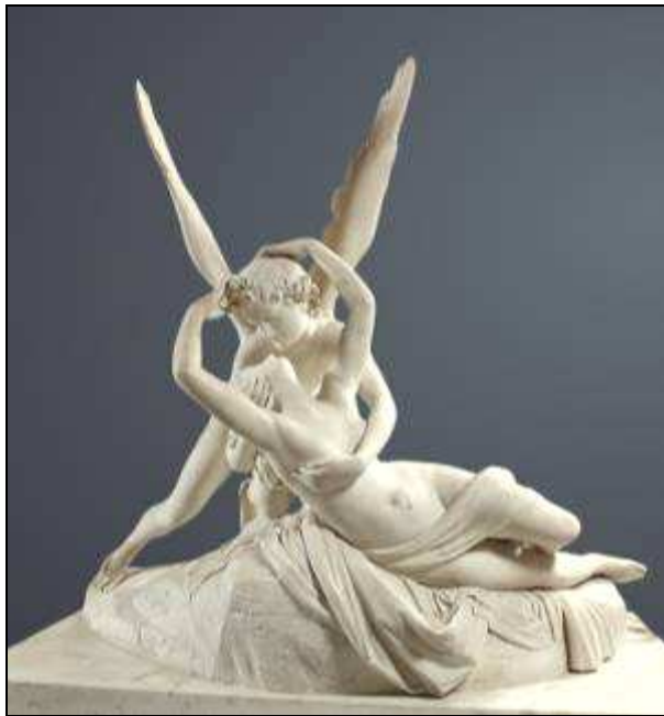
Temple Khajurâho Inde (XIe) Antonio CANOVA Psyché ranimée par le baiser de l'Amour (1793)