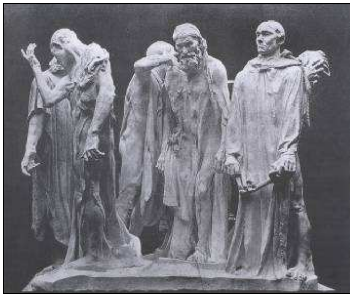
Les bourgeois de Calais Plâtre original 1889