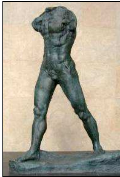
L'homme qui marche 1907