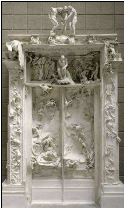
La Porte de l'enfer (plâtre)

Puis le sculpteur prit conscience que cette représentation du bonheur et de la sensualité constituait une œuvre autonome.