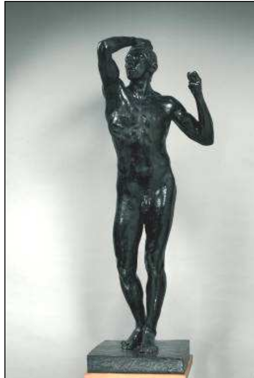
Auguste RODIN L'âge d'airain

Grand modeleur , Rodin influence fortement la sculpture, par l' expressivité des formes , la sensualité des poses et le soin apporté à ses œuvres.