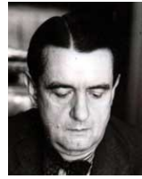
Georges Auric 1899-1983

En 1946 le compositeur français, Georges Auric compose la musique du film de Jean Cocteau « La Belle et la Bête », avec Jean Marais et Josette Day .