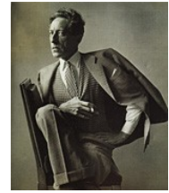
Jean Cocteau 1889-1963

Ecoute chacun des extraits suivants et essaie de retrouver à quel titre ils correspondent :