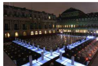
Les 2 plateaux , Daniel BUREN , 1986