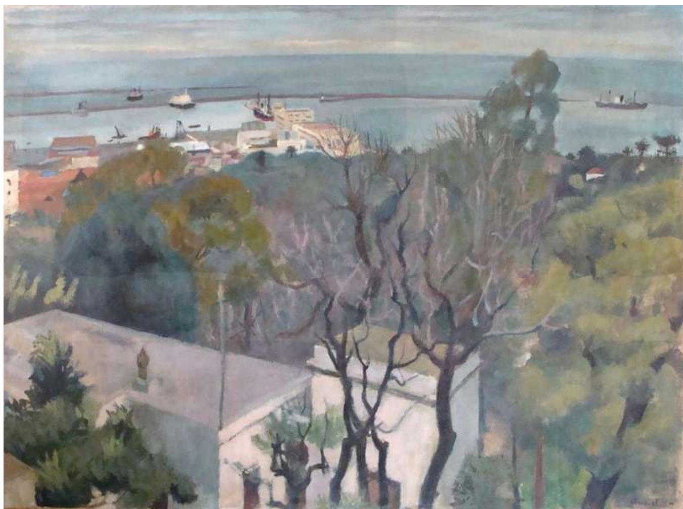
La Rade d'Alger , huile sur toile, 96,5 x 130, Alger, 1954 [Coll. Musée des beaux-arts de Tours, INV. 2000.6.1]

Le Musée des beaux-arts de Tours présentera, du 27 septembre 2019 au 5 janvier 2020, dans le cadre de ses "Expositions de poche" et pour célébrer les 20 ans de la disparition de Jean Vimenet, une exposition consacrée à la période algérienne de l'artiste (1952-1954). Elle réunira une vingtaine d'œuvres environ et divers documents graphiques et photographiques autour de la Rade d'Alger (1954), entrée dans les collections permanentes du musée en 2000(1).