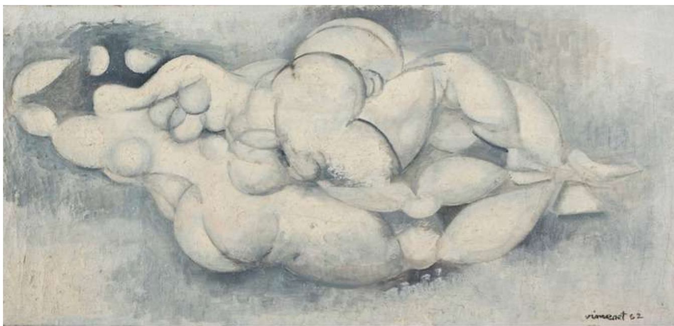
Hommage à Courbet , huile sur toile, 37 x 72, Cachan, 1962