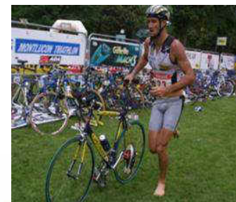
Passage du relais