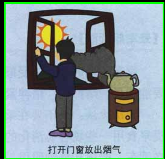
打开门窗放出烟气

4. Ne peut être renier à chacun la liberté de polluer. Sachez simplement partager.