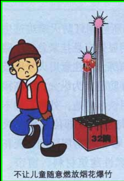
不让儿童随意燃放烟花爆竹

2. Il est fortement conseillé de s'éloigner des feux d'artifice, qui explosent souvent à hauteur du visage.