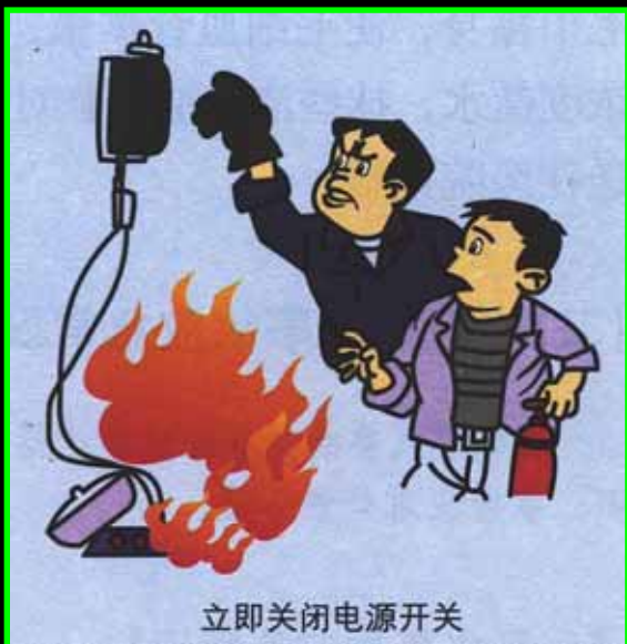
立即关闭电源开关

3. Pour combattre le feu, préférez la paire de gants à l'extincteur, dont la médiocre qualité est souvent cause d'accidents.