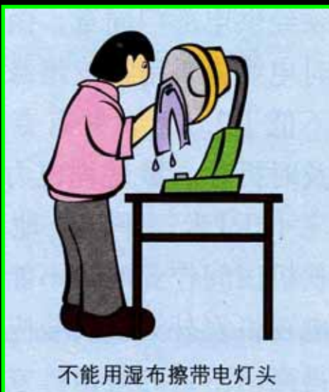
不能用湿布擦带电灯头

2. Les pantalons séchés sous la lumière des lampes ont tendance à rétrécir.