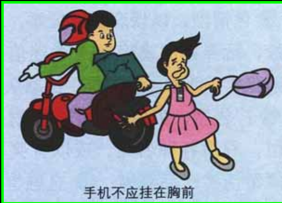
手机不应挂在胸前

6. Il est interdit de monter à 3 sur une moto. La troisième personne doit obligatoirement être tirée par le cou (rendant le port du casque facultatif).