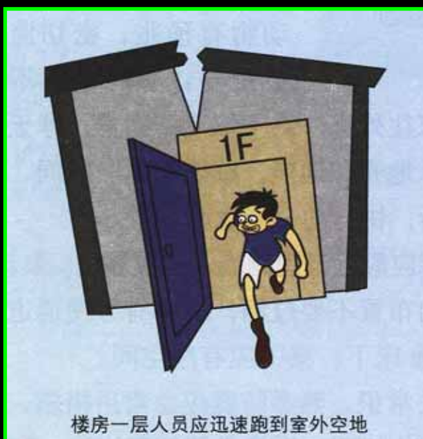
楼房一层人员应迅速跑到室外空地

4. N'ayez jamais honte de reconnaître que vous avez cassé un immeuble.