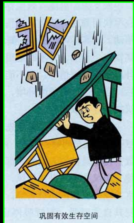
巩固有效生存空间

3. Si vous doutez de la qualité des finitions de votre appartement, attendez la prochain tremblement de terre pour être convaincu (un 0,8 sur l'échelle de Richter devrait suffire).